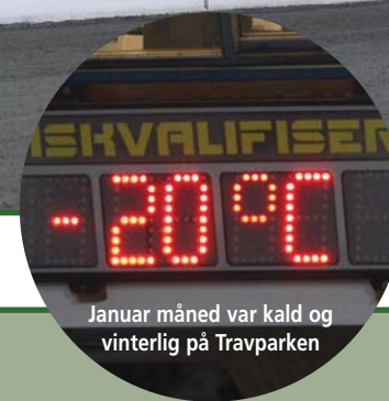
Januar måned var kald og vinterlig på Travparken