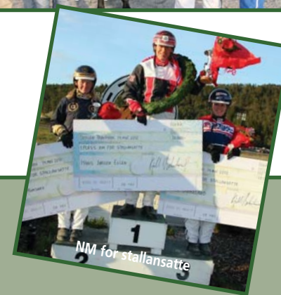
NM for stallansatte