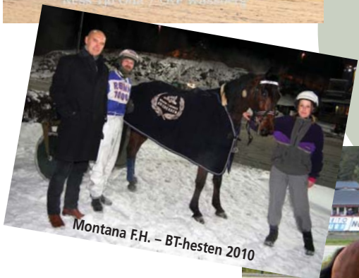
Montana F.H. – BT-hesten 2010