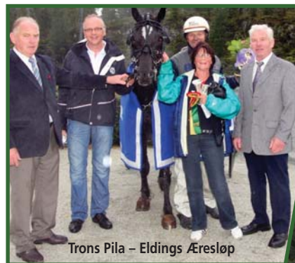
Trons Pila – Eldings Æresløp