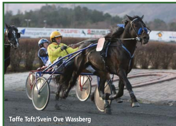
Tøffe Toft/Svein Ove Wassberg