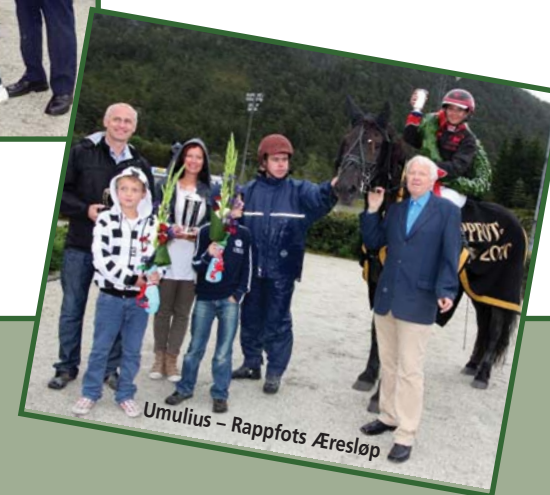
Umulius – Rappfots Æresløp