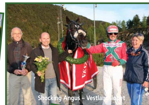
Shocking Angus – Vestlandsløpet