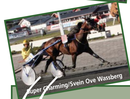
Super Charming/Svein Ove Wassberg